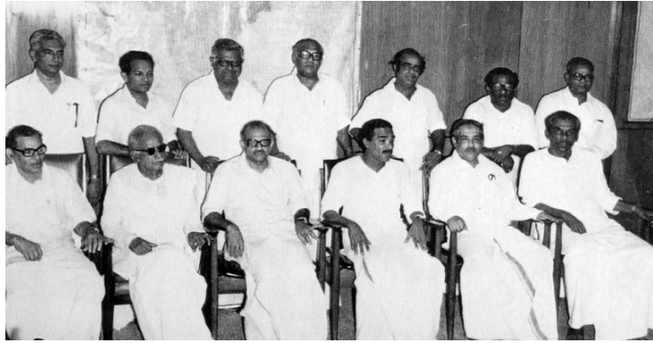
പി കെ വി മന്ത്രിസഭ

1977-ൽ നിയമസഭയിലേയ്ക്ക് തിരഞ്ഞെടുക്കപ്പെട്ട പി കെ വി മന്ത്രിസഭാംഗമായി. വ്യവസായം, വിദ്യാഭ്യാസം വകുപ്പുകളായിരുന്നു കൈകാര്യം ചെയ്തിരുന്നത്. ഏ കെ ആന്റണി മുഖ്യമന്ത്രി സ്ഥാനം രാജിവെച്ചപ്പോൾ പി കെ വി മുഖ്യമന്ത്രിയായി തിരഞ്ഞെടുക്കപ്പെട്ടു. ചുരുങ്ങിയ കാലത്തിനകം തന്നെ കഴിവുറ്റ ഭരണാധികാരിയാണെന്നു തെളിയിക്കാൻ അദ്ദേഹത്തിനു കഴിഞ്ഞു. പി കെ വി മുഖ്യമന്ത്രിയായിരുന്നപ്പോഴായിരുന്നു ദേശവ്യാപകമായി സി ആർ പി എഫുകാരുടെ സമരം നടന്നത്. യുപിയിലും മറ്റും രൂക്ഷമായ സംഘട്ടനങ്ങൾ നടന്നു. കേരളത്തിൽ പള്ളിപ്പുറത്തെ സി ആർ പി എഫ് ക്യാമ്പിലും സമരം തുടങ്ങി. സമരത്തെ പട്ടാളത്തെ ഉപയോഗിച്ചു നേരിടാനായിരുന്നു കേന്ദ്ര സർക്കാർ നിർദ്ദേശിച്ചിരുന്നത്. എന്നാൽ കൂടിയാലോചനകളിലൂടെ ഏറ്റുമുട്ടലില്ലാതെ സമരരംഗത്തുള്ള സി ആർ പി എഫുകാരെ നിരായുധരാക്കാൻ കഴിഞ്ഞത് പി കെ വിയുടെ ഭരണപാടവത്തിന്റെ തെളിവാണ്.